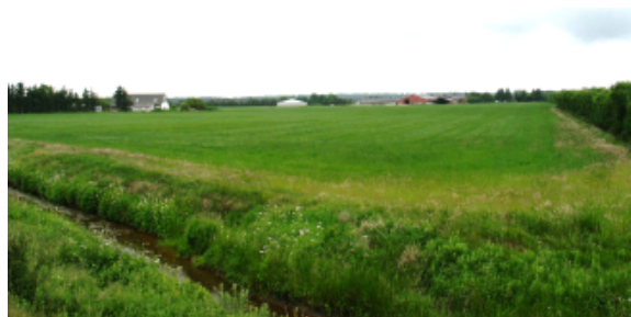
Opdyrkede arealer og gårde syd for Nebel Bæk

Syd for området ligger opdyrkede arealer med spredt bebyggelse i form af stuehuse og landbrugsbygninger langs Lønnehedevej.